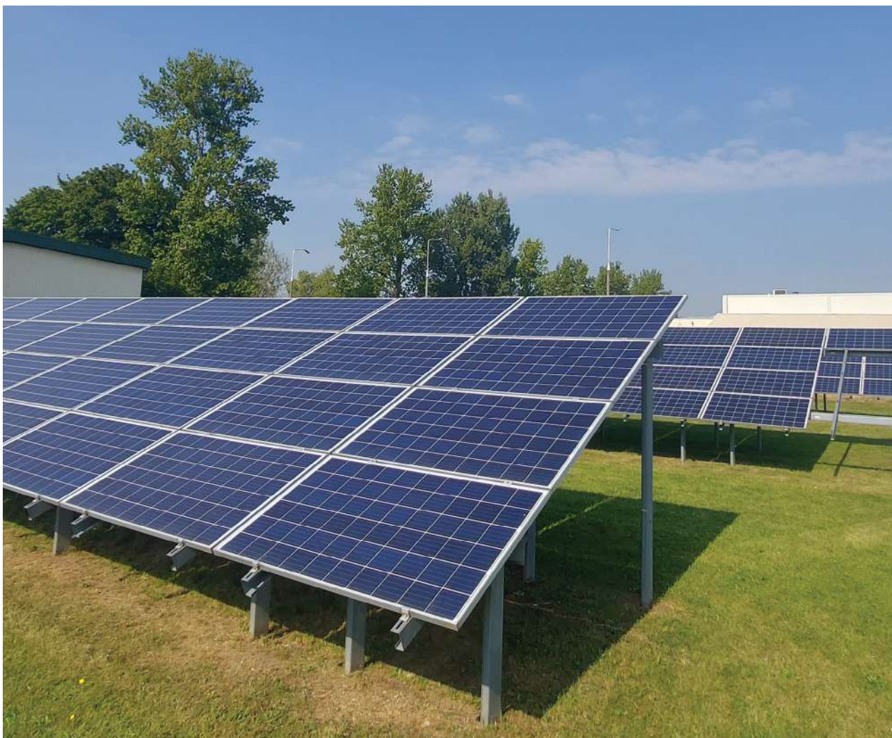
Farma fotowoltaiczna w Anpharmie

energie elektryczną, gaz, ciepło miejskie, wodę. Nominalne zużycie energii w latach 2021–2022 nie zmniejszyło się przy zwiększonej produkcji. W ostatnich dwóch latach firma Servier zrealizowała projekty o wartości ponad 5 mln zł pozwalające na zwiększenie efektywności energetycznej, jak również zapewnienie niezależności w jej dostawie.